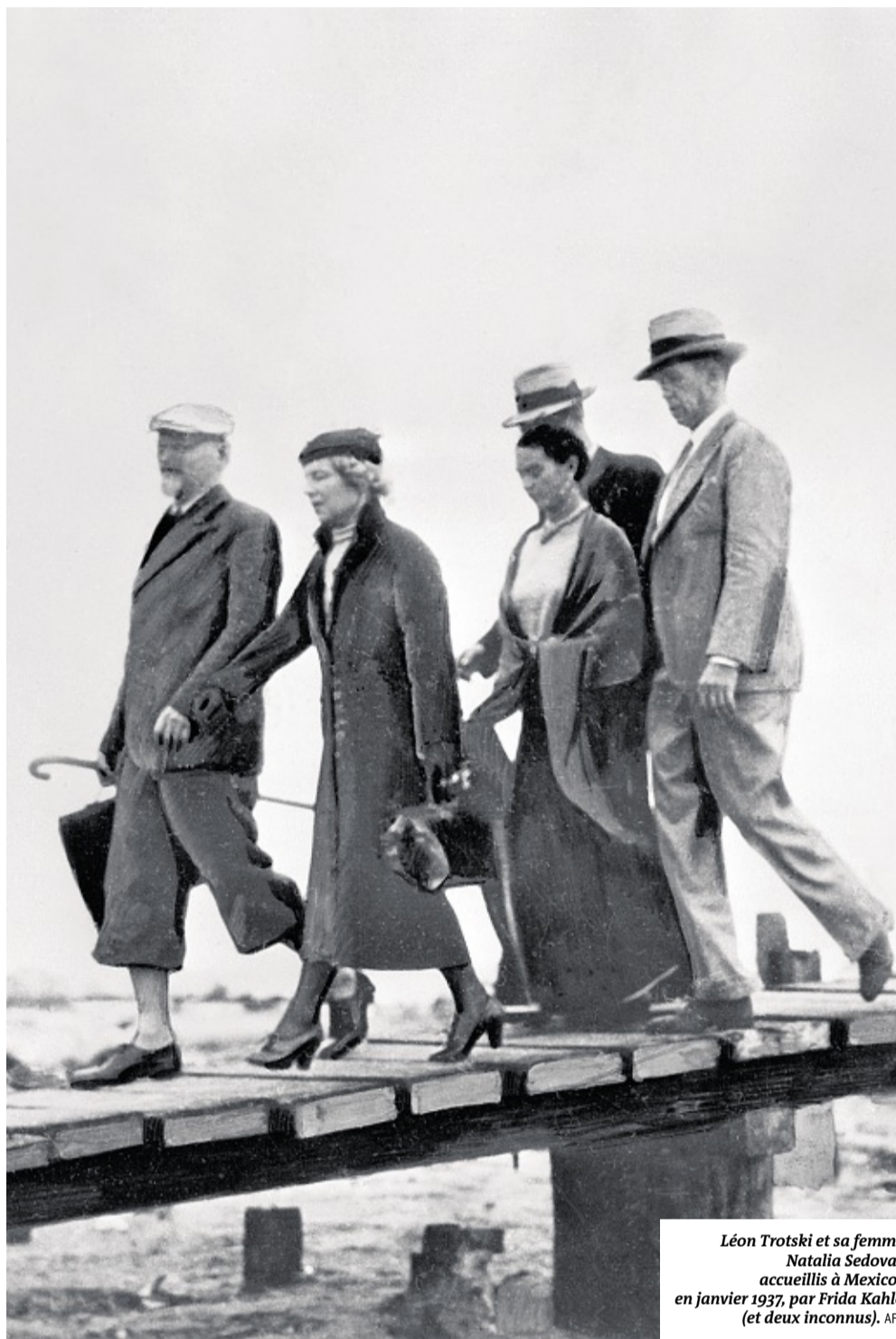
Léon Trotsky et sa femme Natalia Sedova, accueillis à Mexico, en janvier 1937, par Frida Kahlo (et deux inconnus)

Le trait cinglant ou chaleureux, Patrick Deville réussit, en une trentaine de courts tableaux, à faire de ces années mexicaines une fantastique scène de théâtre, où les personnages entrent et sortent, façon vaudeville ou tragédie. De Coyoacan à Guadalajara, outre les « premiers rôles » que sont Lowry et Trotsky, on rencontre Antonin Artaud, en manque