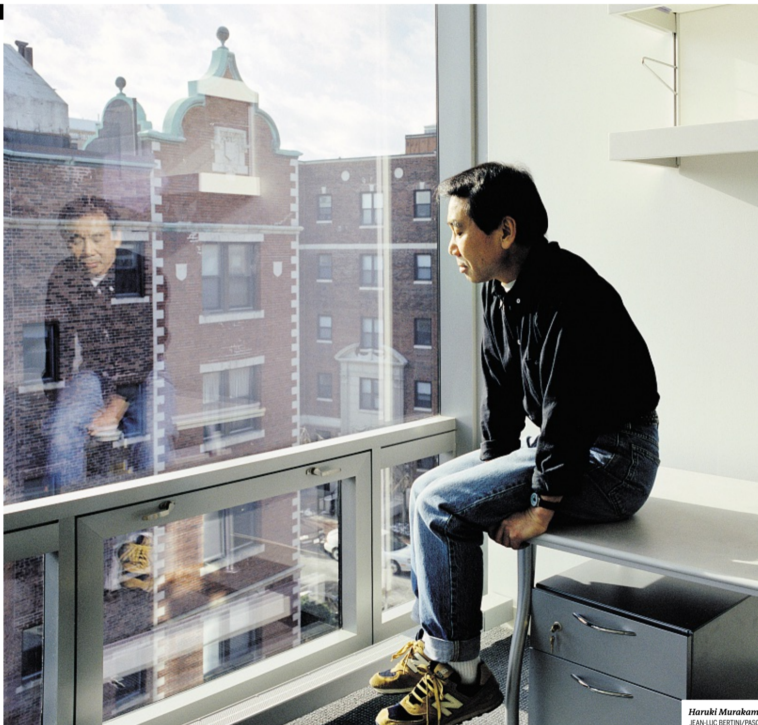
Haruki Murakami.

Le club des cinq. Ils étaient cinq amis au lycée de Nagoya. Aujourd'hui, à 36 ans, Tsukuru est seul dans Tokyo. Car un jour, sans prévenir, ses amis lui ont dit qu'ils ne voulaient plus jamais le voir. Tsukuru n'a pas posé de questions. Avant qu'une femme (la première qui lui donne envie de combler ce vide en lui) ne le pousse à entreprendre un pèlerinage à Nagoya et en Finlande, sur les traces de ses amitiés évaporées. L'amitié et l'amour sont toujours au cœur des romans d'Haruki Murakami, et sur un mode souvent aussi réaliste que naïf. Epurés, débarrassés de la complexité psychologique que la fiction s'acharne par la suite à montrer plus qu'à expliciter. Ainsi, Tsukuru a-t-il toujours été discrètement jaloux des prénoms de ses amis, car tous comportaient une couleur dans leurs idéogrammes. Il se sentait comme à l'écart, déjà. Seul. Deux jeunes filles, trois jeunes garçons : il faut bien qu'il y en ait un de trop. Tsukuru a cru que cette amitié adolescente était la clé d'une harmonie supérieure qui n'admettait ni le sexe ni le doute. Et quand il s'est retrouvé seul, il a passé six mois à maigrir et à penser à