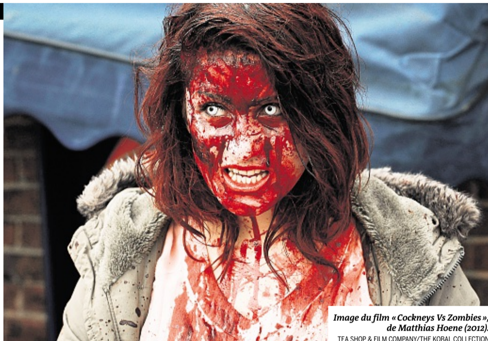
Image du film « Cockneys Vs Zombies », de Matthias Hoene (2012).

Plus civilisés sont les zombies de Daryl Gregory. « Ma chair est terne hélas et j'ai lu bien des livres, reclus dans la cave